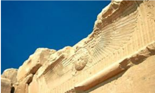
Fig.4 Ra, Dio del Sole egiziano. Secondo il culto, Ra ha creato l'Universo lui stesso da un tumulo primordiale piramidale e poi tutti gli altri

Fig. 3 Ra, Dio del Sole egiziano. Secondo il culto, Shamash Dio Sole nella mitologia mesopotamica. Palazzo di nord-ovest, Nimrud ; 865-860 a.C.