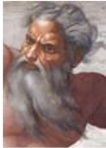
Fig. 2 Egiziano Iao, poi YHWH, IEUE, Yahvè Jehovah e infine Jahvè